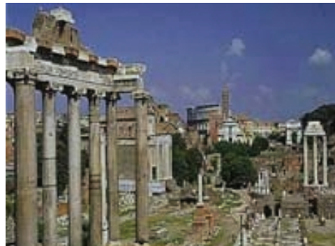
Foroaren hondakinak, Erroma

Mexikoko hiriburua da gaur egun munduko biztanle gehien dituen hiria, hogeit hamar milioi inguru. Mexikoko hiriguneak Tenochtitlán bailara zaharraren mugak gainditu ditu eta inguruko hiri asko xurgatzen ari da. Egoera hau arrunta da munduan zeharreko hirietan, zeintzuen hazkuntzan topatzen dituzten beste hirigune hauek xurgatzen dituzte azkenean. Honek askotan zail egiten du hiri bat non hasten eta bestea non bukatzen den zehaztea. Kasu honen adibide esanguratsua, Megapolis deitutakoa da, Estatu Batuetan, beste batzuen artean New York, Boston eta Filadelfia hiriak lotzen dituen mila milioi baino luzeagoa den hirigune jarrai bat da.